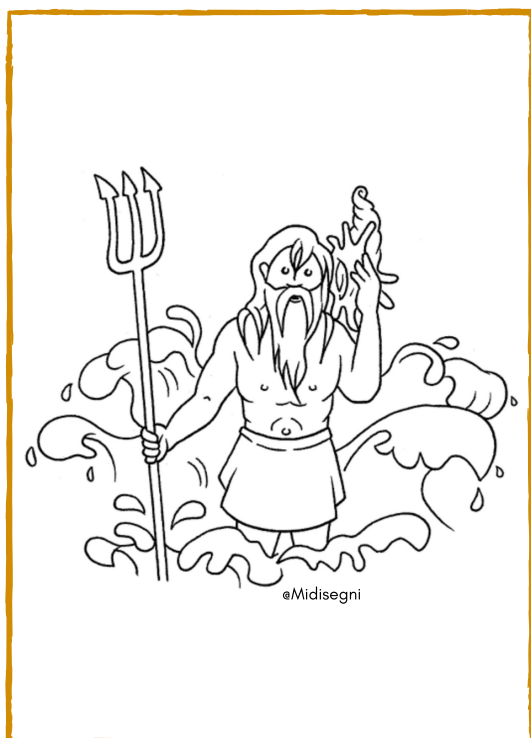
POSEIDONE - NETTUNO