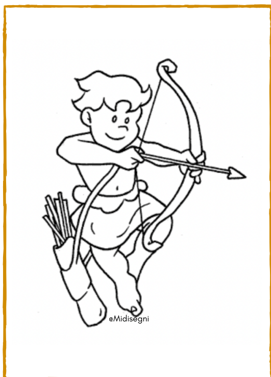
EROS - CUPIDO