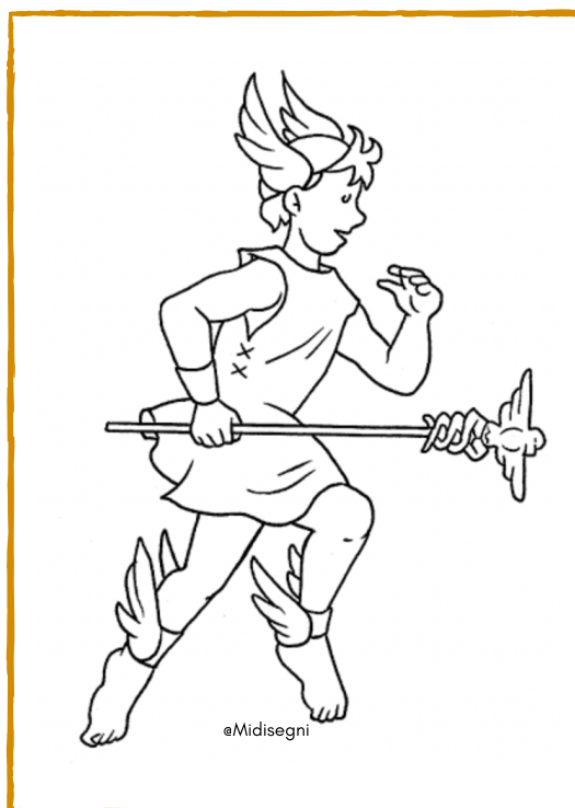
ERMES - MERCURIO

OB. Rielaborare informazioni Ricavare informazioni; comprendere aspetti caratterizzanti le civiltà studiate