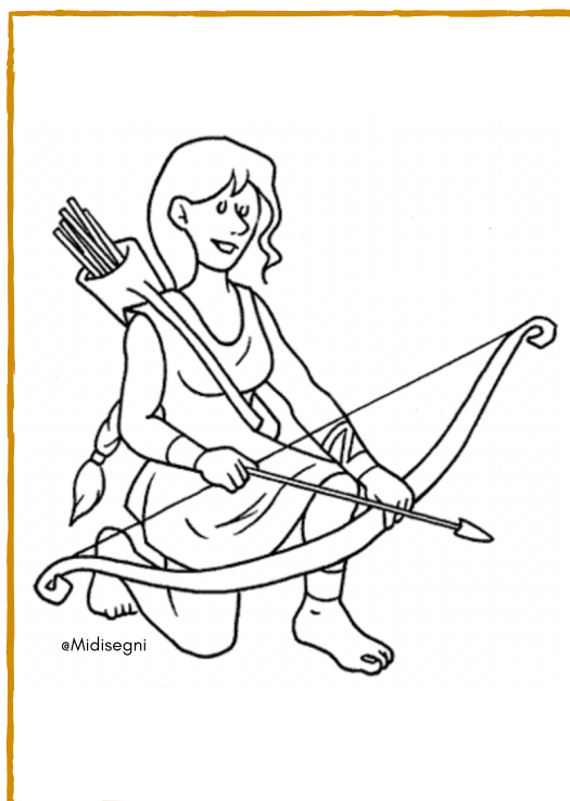
ARTEMIDE - DIANA

OB. Rielaborare informazioni Ricavare informazioni; comprendere aspetti caratterizzanti le civiltà studiate