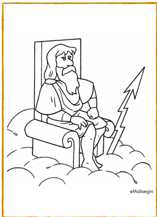
ZEUS - GIOVE