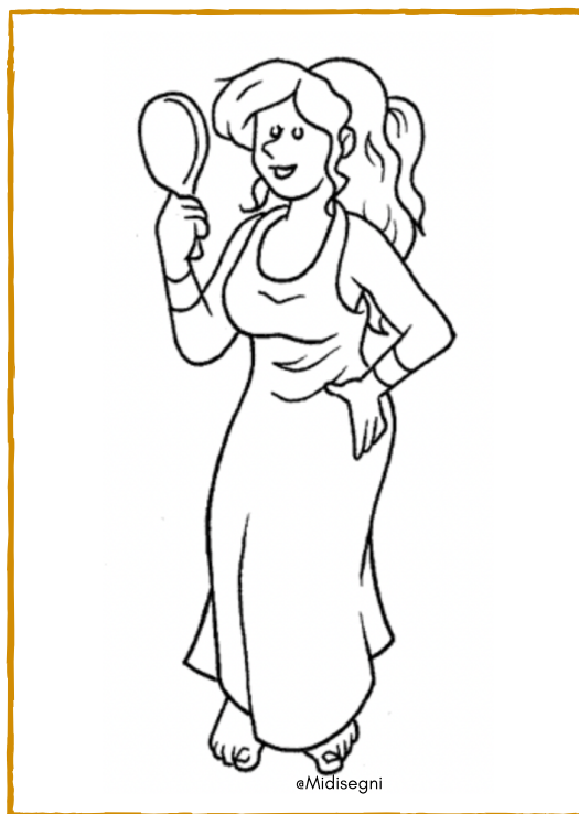
AFRODITE - VENERE